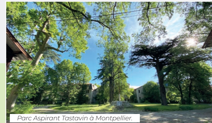
Parc Aspirant Tastavin à Montpellier.

À Montpellier et dans le canton, les associations de quartier créent un lien social fort entre les habitants et nous les avons soutenues : Aiguelongue Justice au Cœur, Bien Vivre à l'Aiguelongue, Boutentrain, Leo de Boutonnet, le Devoir..., elles sont indispensables au bien vivre ensemble.