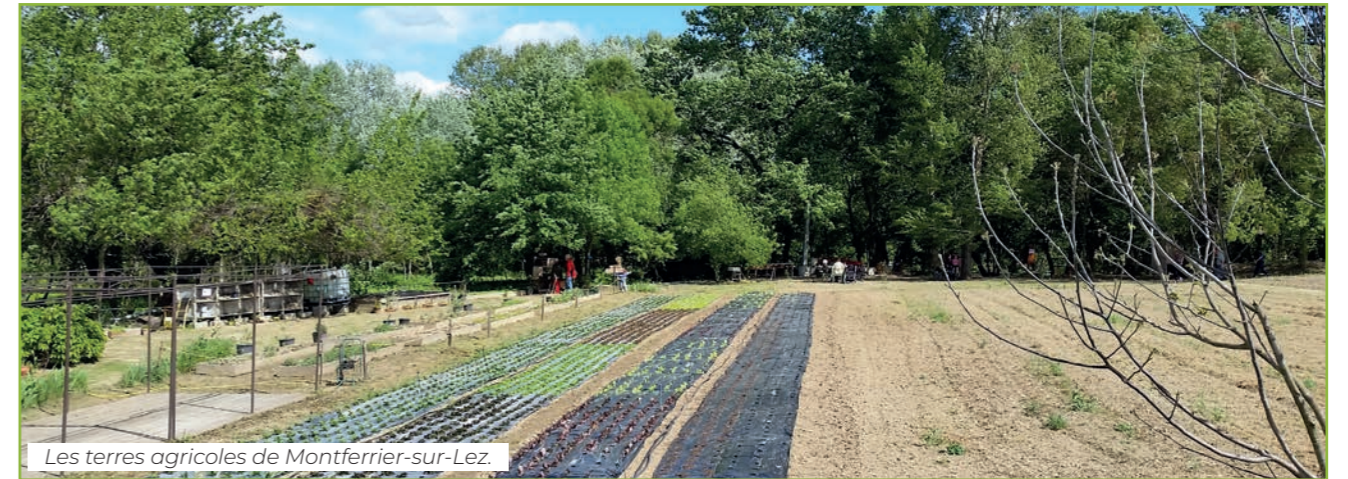
Les terres agricoles de Montferrier-sur-Lez.