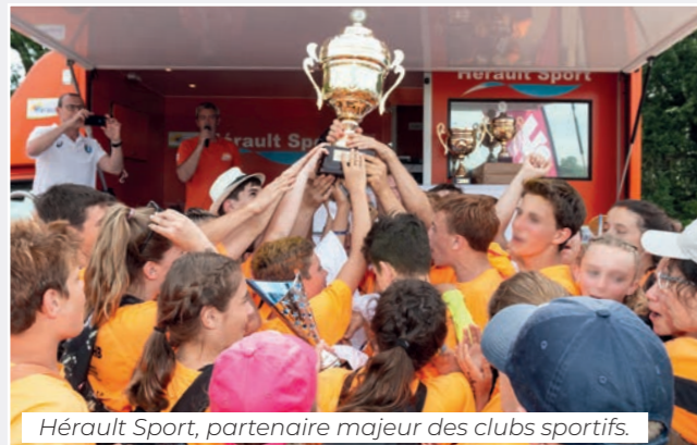
Hérault Sport, partenaire majeur des clubs sportifs.