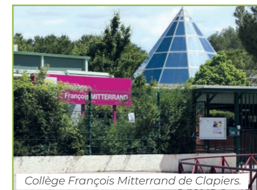
Collège François Mitterrand de Clapiers.

Depuis 2020, plusieurs enfants de Castelnau-le-Lez (Courtareilles, Caylus, Domaine des Oliviers) sont scolarisés au collège de Clapiers. La Métropole plantera sur la RM 21 un feu tricolore avec appel piéton pour permettre la sécurisation de sa traversée, puis dans un second temps, un rond-point permettant de ralentir la vitesse et une piste cyclable pour que les jeunes puissent rejoindre leur collège en toute sécurité.