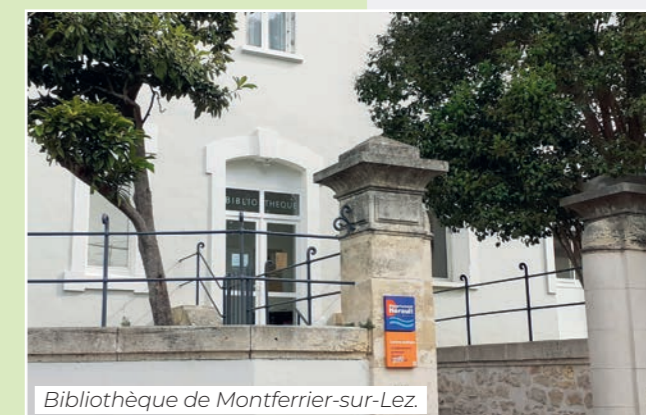
Bibliothèque de Montferrier-sur-Lez.