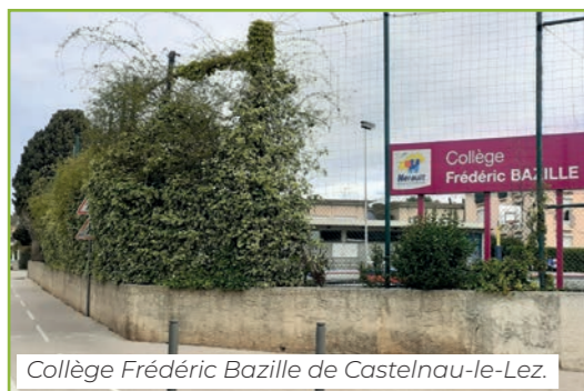
Collège Frédéric Bazille de Castelnau-le-Lez.