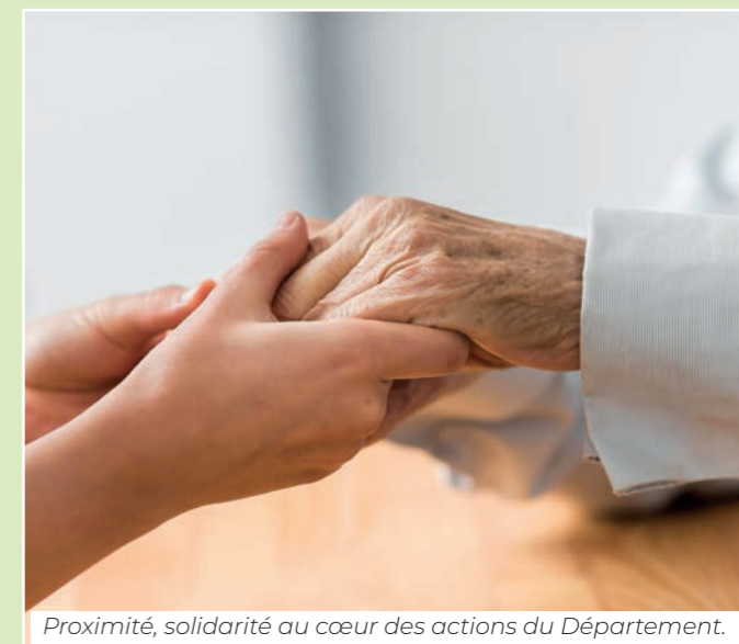
Proximité, solidarité au cœur des actions du Département.

Prendre soin les uns des autres, c'est aussi permettre aux plus fragiles d'entre nous d'accéder à la culture. Le Département a créé les opérations « Culture en arc en ciel » pour nos anciens vivant dans les EPHAD, « Pouss'culture » pour les jeunes recueillis dans les Maisons d'Enfants à Caractère Social ou « Une saison pour vous » pour les familles rencontrant des difficultés de vie.