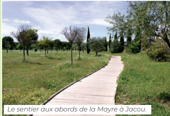
Le sentier aux abords de la Mayre à Jacou.

Le Département assure aussi l'entretien et la gestion de plus de 1 000 kms de pistes de randonnée pédestres et cyclables du réseau vert et subventionne les communes qui s'engagent dans la réalisation de sentiers pédestres municipaux comme le sentier de la Mayre à Jacou.