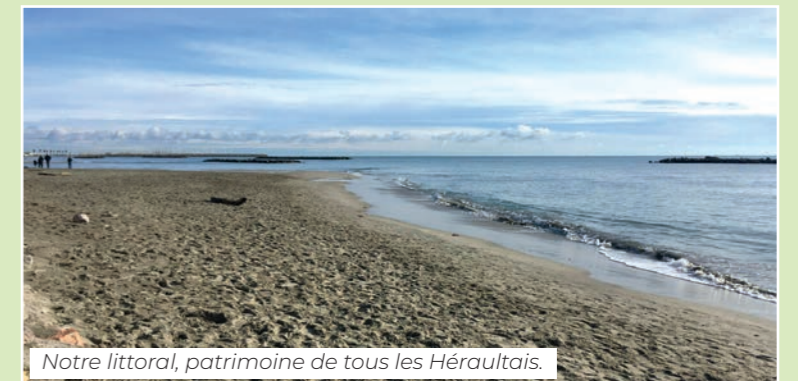
Notre littoral, patrimoine de tous les Héraultais.

Le Plan Littoral de la Majorité départementale prévoit d'investir plus de 350 millions d'euros ces prochaines années pour sauver le littoral de l'érosion. C'est indispensable pour préserver le trait de côte, nous devons le poursuivre. Ce projet global favorisera les déplacements doux, assurera une bonne qualité des eaux de baignade et protégera les cordons dunaires.