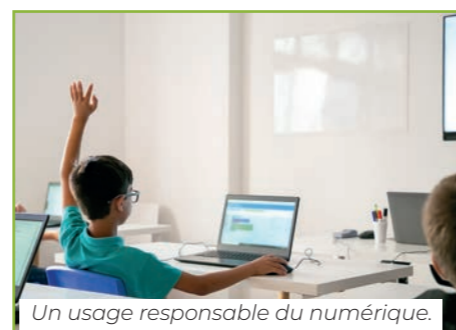
Un usage responsable du numérique.