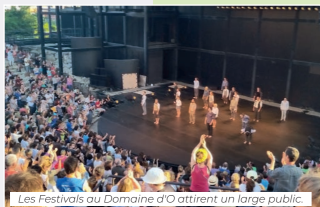
Les Festivals au Domaine d'O attirent un large public.