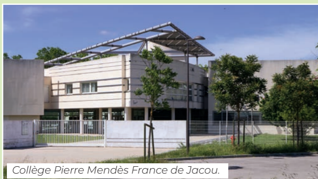
Collège Pierre Mendès France de Jacou.