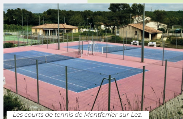
Les courts de tennis de Montferrier-sur-Lez.