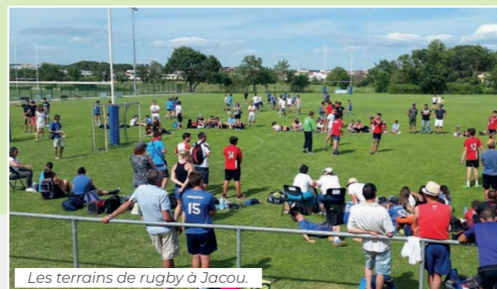
Les terrains de rugby à Jacou.