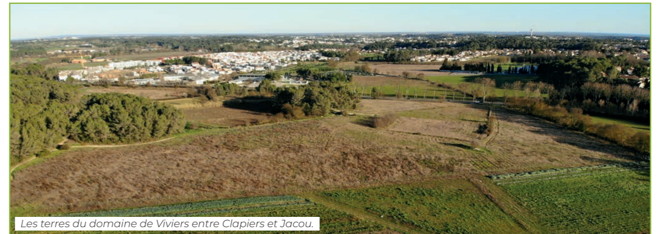
Les terres du domaine de Viviers entre Clapiers et Jacou.