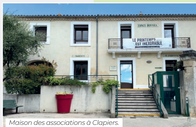
Maison des associations à Clapiers.