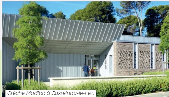
Crèche Madiba à Castelnaud-le-Lez.