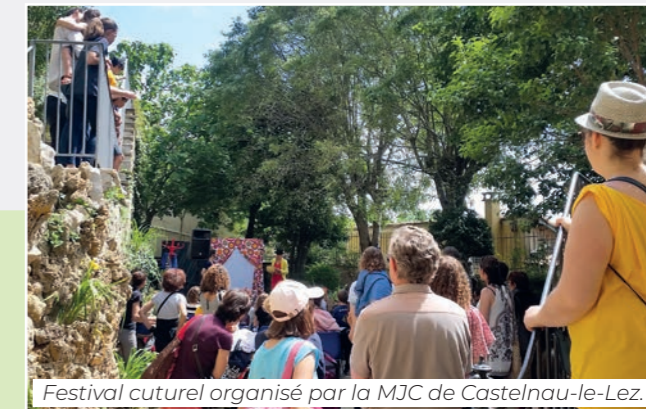
Festival culturel organisé par la MJC de Castelnaud-le-Lez.