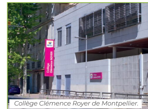
Collège Clémence Royer de Montpellier.

En coordination avec la Ville et la Métropole de Montpellier, nous agissons pour sécuriser le chemin des collégiens et apaiser la circulation. Aux abords du collège Clémence Royer, nous demanderons la sécurisation des traversées des quais du Verdanson aujourd'hui très dangereuses. Les temps d'attente seront réduits et une signalisation renforcée sera mise en place au bénéfice des piétons. De la même façon, aux abords du collège du Jeu de Mail, nous améliorerons la sécurité des traversées autour de la colonne Saint-Eloi. Par ailleurs, nous équiperons les collèges d'abris à vélos et de dispositifs adaptés (arceaux sécurisés, gonfleurs) pour faciliter l'usage du vélo au quotidien.