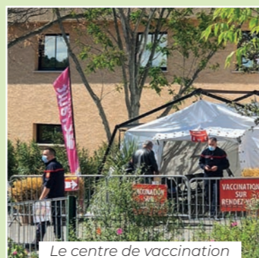
Le centre de vaccination du SDIS à Vailhauquès.

Depuis le mois de janvier, le SDIS 34 est pleinement engagé dans la mise en œuvre des centres de vaccination, aux côtés des associations de protection civile et des professionnels de santé.