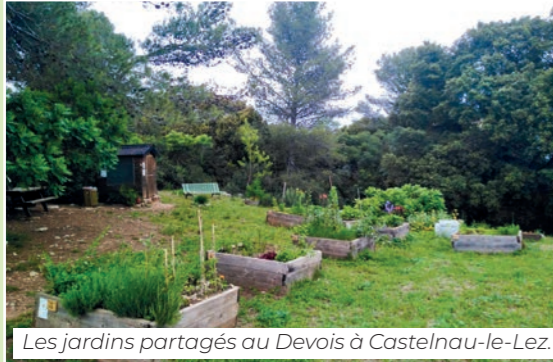
Les jardins partagés au Devois à Castelnaud-le-Lez.

Dans l'Hérault, le conseil départemental gère plus de 9 000 hectares d'espaces naturels sensibles. La Maison départementale de l'Environnement accueille 150 000 visiteurs par an et accompagne de nombreuses associations. Dans notre canton, nous devons absolument préserver tous nos espaces boisés, protégés par nos pompiers.